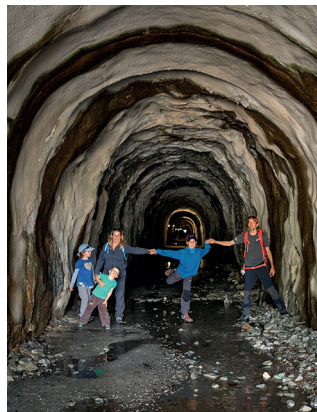
Kühles Loch: Die Durchquerung dauert eine Viertelstunde.