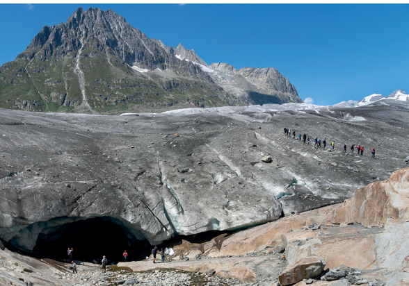
Eisiges Loch: Beim Aletschgletscher fühlt man sich unbedeutend.

Berghütte Horli-Hitta Fiescheralp, 027 971 24 24, www.aletscharena.ch Gletscherstube, 027 971 47 83, www.gletscherstube.ch