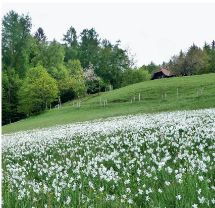
Wie Schnee im Mai: Unterhalb des Cubly blühen die Narzissen.