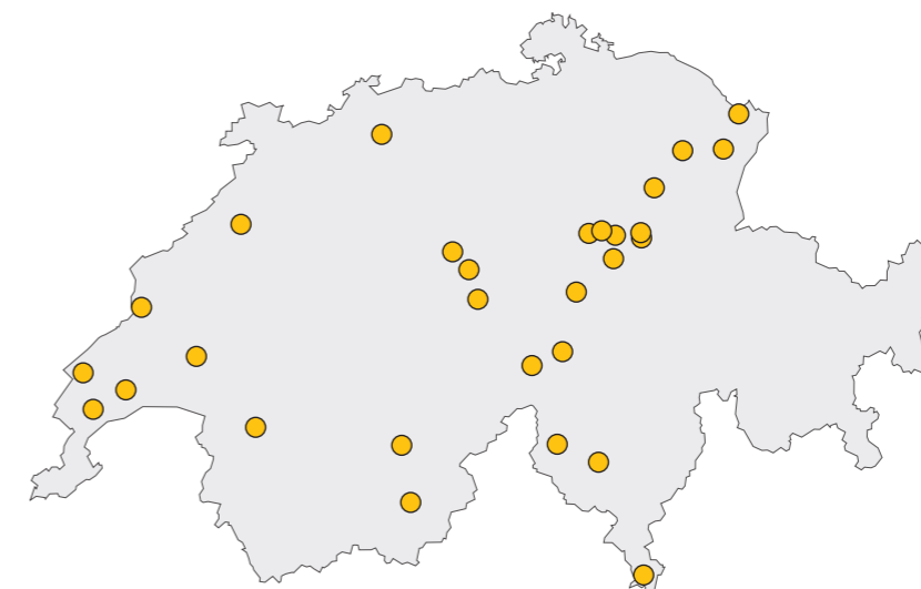
LES SITES DES PROJETS DE CHEMINS AYANT BÉNÉFICIÉ D'UN SOUTIEN EN 2025

■ SUISSE-RANDO.CH/FONDS-DE-PROJETS ■ PRIXRANDO.CH/FR