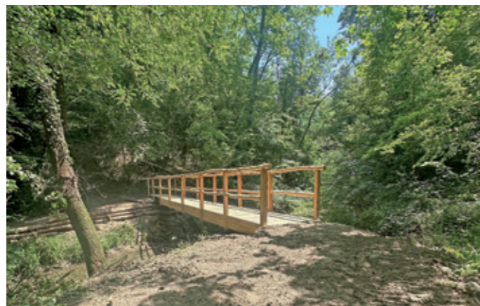
L'UN DES DEUX NOUVEAUX PONTS EN BOIS