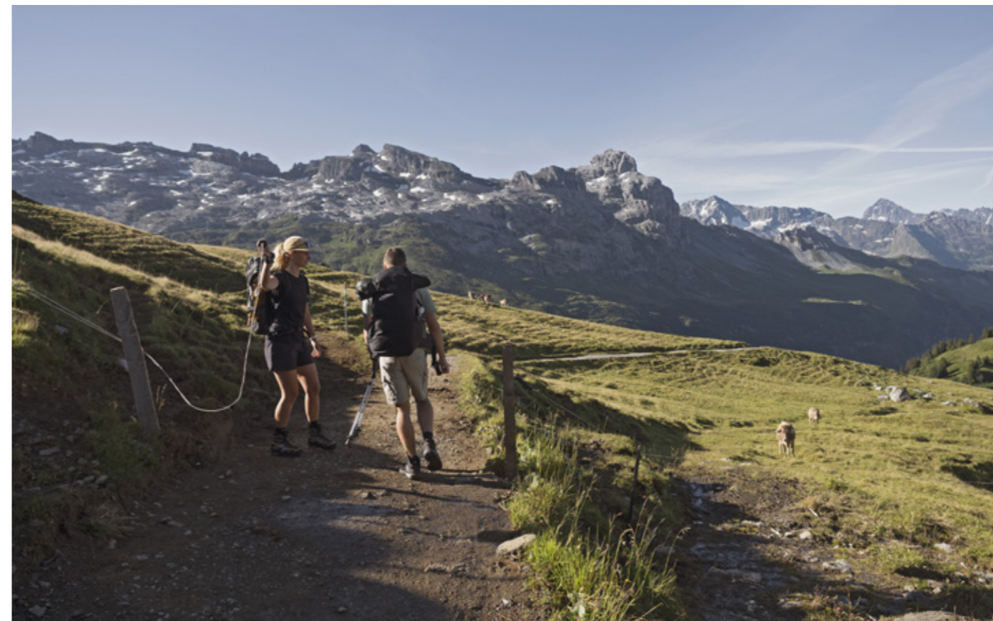
IL FAUDRAIT TOUJOURS REFERMER LES PASSAGES DE CLÔTURE APRÈS LES AVOIR FRANCHIS.

En Suisse, quelque 26 000 kilomètres de chemins traversent prairies et pâturages. Avec le nombre croissant d'élevages de vaches allaitantes et le recours aux chiens de protection des troupeaux, les rencontres entre humains et animaux se multiplient. La plus souvent, tout se passe au mieux et les incidents sont rares.