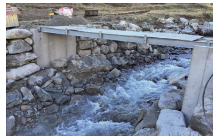
LE NOUVEAU PONT MOBILE AVEC DES FONDATIONS EN BÉTON

Le Fonds de projets Chemins de randonnée pédestre a été créé en 2014 à la suite d'un don important en faveur de Suisse Rando. Depuis, plus de 180 projets ont été soutenus. Tous les deux ans, le Prix Rando distingue les projets remplissant les objectifs de qualité pour les chemins pédestres d'une manière tout à fait remarquable. La prochaine cérémonie de remise des prix aura lieu en septembre 2026 lors du Sommet suisse de la randonnée organisé à Saanen, près de Gstaad.