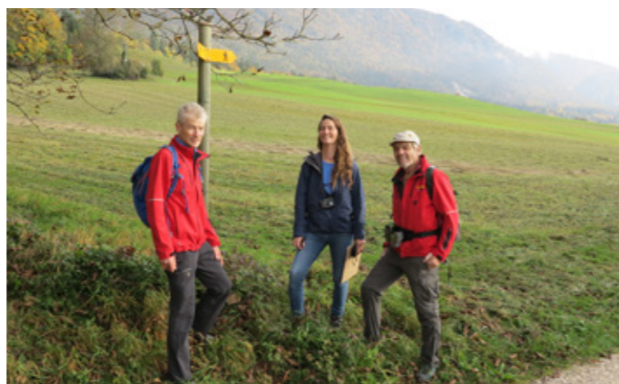
DES MEMBRES DE SUISSE RANDO ET DES SOLOTHURNER WANDERWEGE CHARGÉS DE LA TECHNIQUE LORS D'UNE VISITE DE CONTRÔLE

Véritable étendard de la Suisse en tant que destination de randonnée, «La Suisse à pied» répond aux exigences d'un large public et comprend aussi bien d'agréables parcours d'un jour que des randonnées de longue distance de plusieurs jours. Les itinéraires se distinguent par des thèmes ou des accents régionaux, et 86 d'entre eux sont aménagés sans obstacles pour les personnes à mobilité réduite.