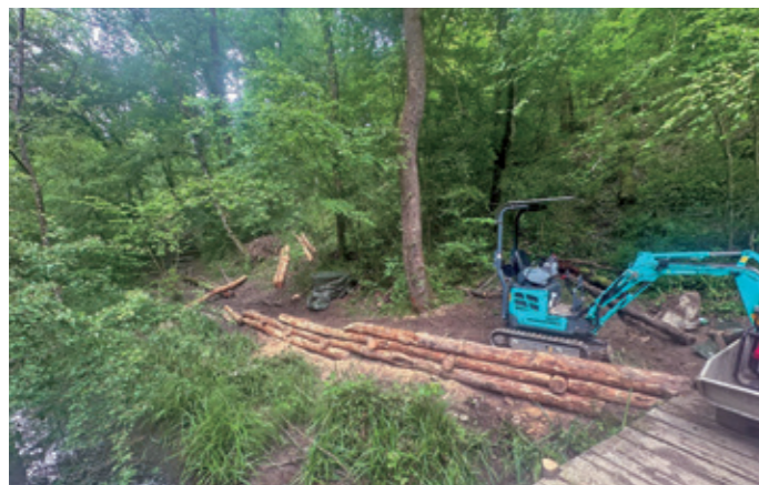
CONSOLIDATION DU CHEMIN MENACÉ PAR L'ÉROSION