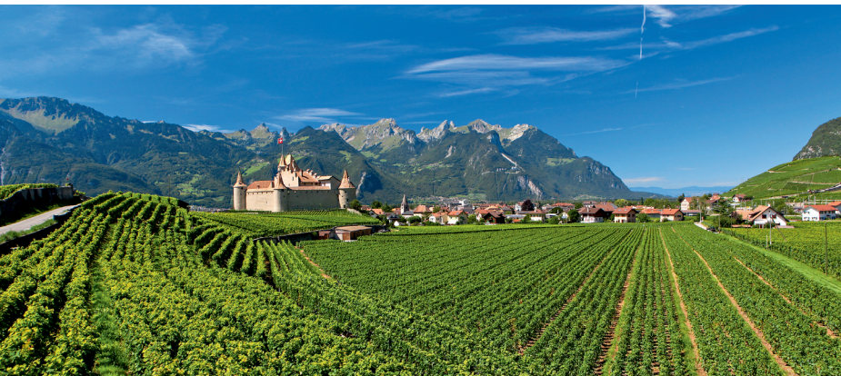
Des vignes à perte de vue. Au milieu trône le Château d'Aigle.

La Pinte du Paradis au Château d'Aigle, 024 466 18 44 Restaurant de l'Hôtel-de-Ville, Ollon, 024 499 19 22