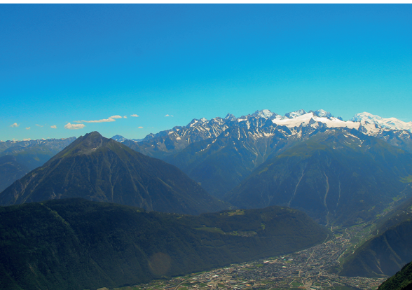
Le Catogne, à gauche sur la photo, appartient, d'un point de vue géologique, aux sommets glacés du massif du Mont Blanc.

Jardin botanique alpin Flore Alpe, Champex-Lac, 027 783 12 17, www.flore-alpe.ch