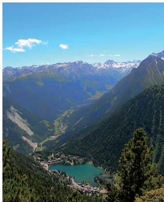
Lors de la descente, une vue superbe sur le lac de Champex.