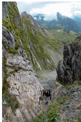
Vue spectaculaire sur le Lättgässli.