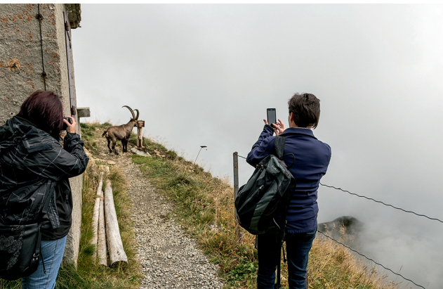
Près du restaurant Rothorn Kulm, un bouquetin se délecte de sel.

Bergbahnen Sörenberg, 041 488 21 21 Erlebnis-Restaurant Rossweid, 041 488 14 70 Gipfel-Restaurant Rothorn, 033 951 26 27 www.soerenberg.ch