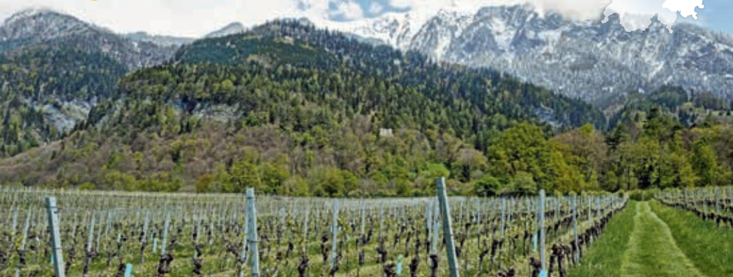
Vignes en fleurs et feuillus vert clair devant des versants de montagne enneigés.