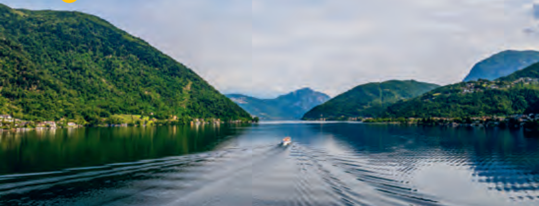
Vue sur le lac de Lugano. Une belle conclusion après une randonnée urbaine.