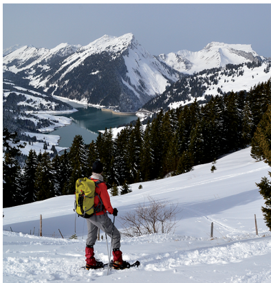
Lorsque l'on aperçoit le lac de l'Hongrin, le sommet n'est plus très loin.