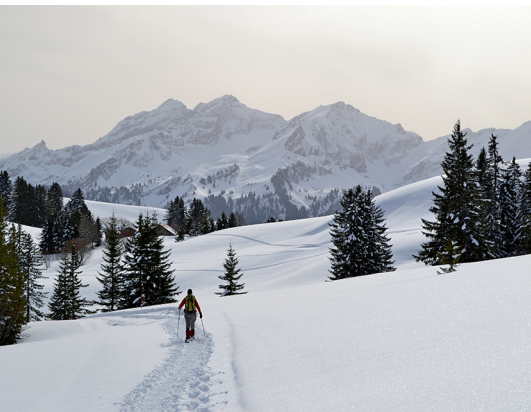
Sur le plateau du Fenil aux Veaux, on aperçoit les sommets escarpés de la Gummfluh.

Cabane des Monts Chevreuil, 077 479 90 86, www.monts-chevreuil.ch/cabane.html (sur réservation)