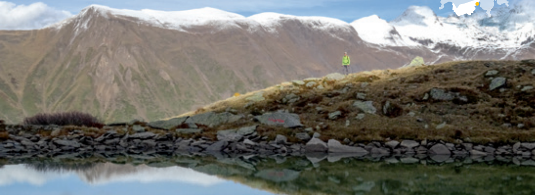
Spiegelbild der Berge im Schaplersee