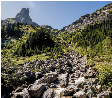
Regard vers l'arrière. On longe le ruisseau Chantbach pour rejoindre la vallée de Soustal.