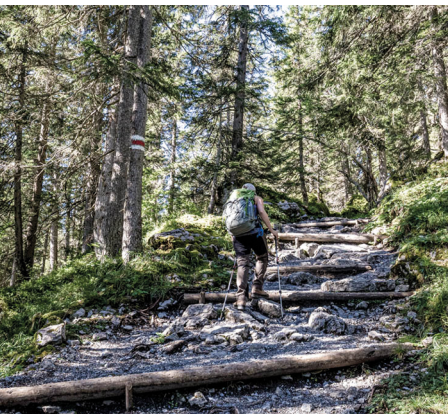
Les premiers mètres de dénivelé se font à l'ombre de la forêt.

On accède à Sulwald en car postal et en téléphérique depuis Lauterbrunnen. Retour à Lauterbrunnen en téléphérique depuis Grütschalp.