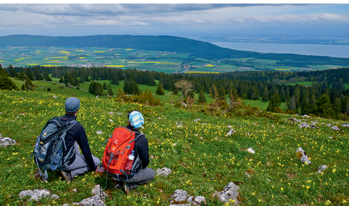
Tout au long de la randonnée, on peut admirer des vues superbes sur le lac de Neuchâtel et les Alpes.

Ferme située le long du chemin: www.lesguemmenen.ch , aventure sur la paille, chambres, restaurant Tourisme neuchâtois, www.neuchatel-tourisme.ch