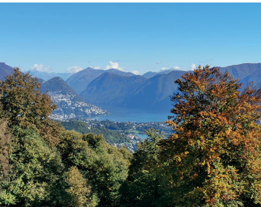
Le Malcantone. La randonnée offre de superbes vues sur le lac de Lugano.

Agritourisme Ristoro ai Gelsi, Iseo, 079 760 94 12