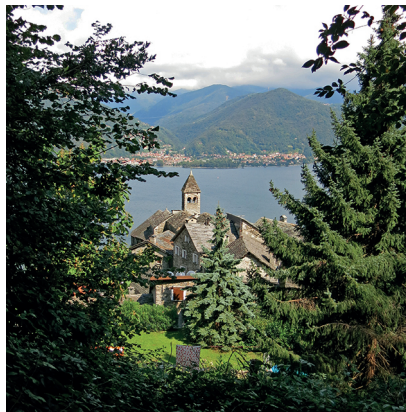
Blick durch den Wald auf Cármine Superiore, wo der Wanderer in eine vergangene Zeit eintaucht.