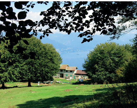
Von der Alp Pro Redond ist es nicht mehr weit bis auf den Monte Carza.

Cannobio ist am einfachsten per Schiff ab Locarno erreichbar (SBB-Fahrplan: Cannobio NLM). Beim Nachschlagen des Fahrplans darf Cannobio nicht mit Canobbio (bei Lugano) verwechselt werden.